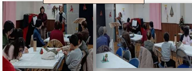
桜ヶ丘会館ホールにて開催

12月21日(日) 11時～14時 町内ボランティアG「みんなよっといで!」の皆さんにより「クリスマスだよ！よっといで!!」が開催され、シチュー&ロールパンセット プチケーキ付が提供され多くの人で賑わいました。バイオリンとピアノ演奏が行われ、最後にビンゴゲームが行われました。