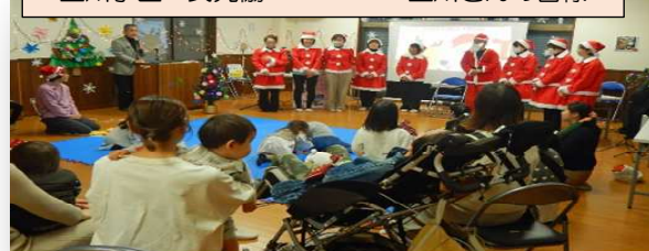
玉川学区 民児協 BushClover 玉川さんの皆様

12月25日(木) 10時30分～ 町内会主催・チェリーキッズ・桜ヶ丘民児協共催にて、未就学児対象のクリスマス会を開催。桜ヶ丘在住 15名の児童と保護者が参加されました。BushClover 玉川の皆様による、紙芝居・ベル演奏等の演出あり、最後に桜ヶ丘サンタによる、プレゼントが参加者全員に配られました。