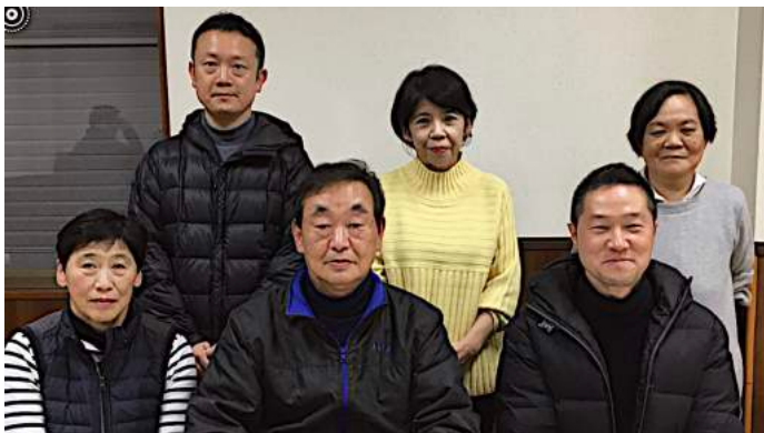
文化厚生体育委員会