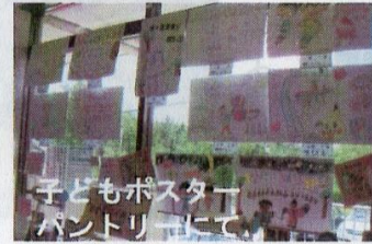
子どもポスター パントリーにて