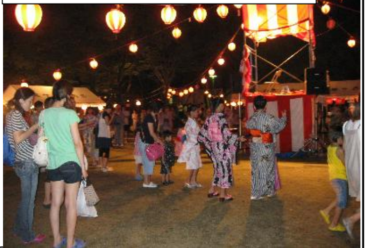
桜ヶ丘音頭：大勢の参加で盛り上がりました