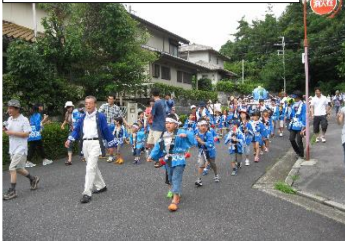
神輿巡行：大勢の子供達でにぎやかでした